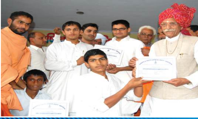
स्व० महाशय धर्मपाल जी (एमडीएच) द्वारा छात्रों का सम्मान