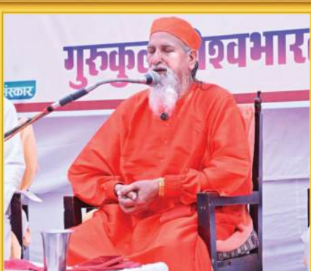
स्वामी ब्रह्ममूर्ति योगतीर्थ जी