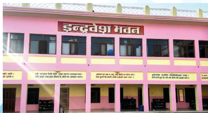
इन्द्रवेश भवन छात्रावास ( कक्षा 5वीं, 6वीं )