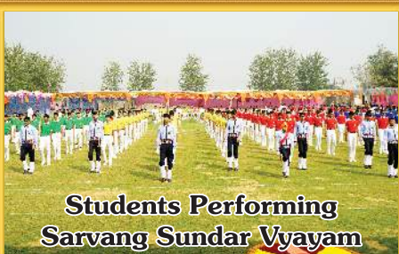
Students Performing Sarvang Sundar Vyayam