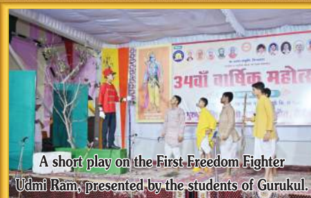
A short play on the First Freedom Fighter Udmil Ram, presented by the students of Gurukul.