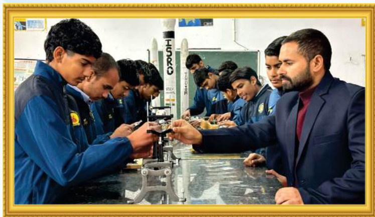
भौतिकी विज्ञान प्रयोगशाला