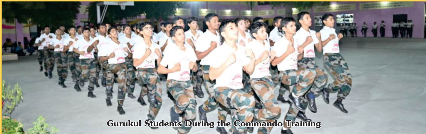
Gurukul Students During the Commando Training