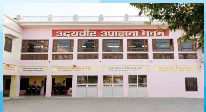
उदयवीर उपासना भवन छात्रावास ( सामूहिक संध्या हवन हेतु )