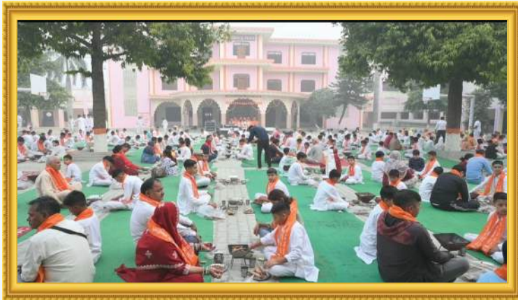
स्वामी दयानन्द सरस्वती जी के 200वीं जयंती के उपलक्ष्य में आयोजित 200 कुंडीय यज्ञ