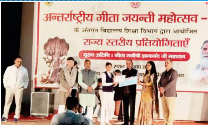
राज्यस्तरीय श्लोक उच्चारण प्रतियोगिता में द्वितीय स्थान