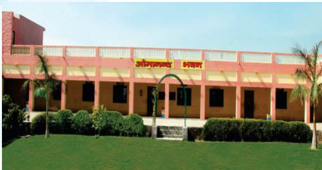
ओमानन्द भवन छात्रावास ( कक्षा 9वीं, 10वीं )