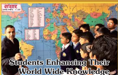
Students Enhancing Their World Wide Knowledge