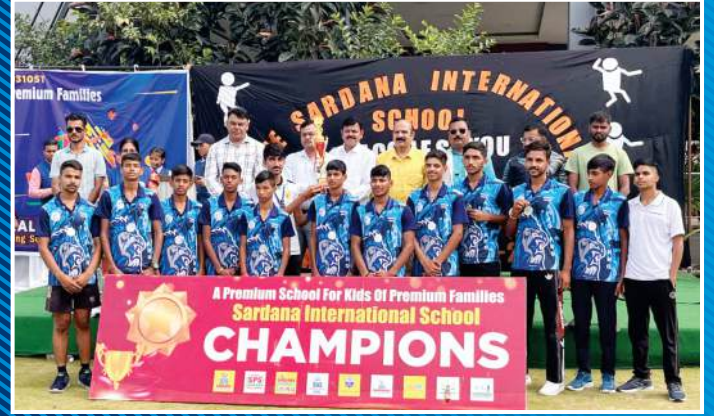
राष्ट्रीय स्तर पर खो-खो प्रतियोगिता में गुरुकुल टीम का द्वितीय स्थान