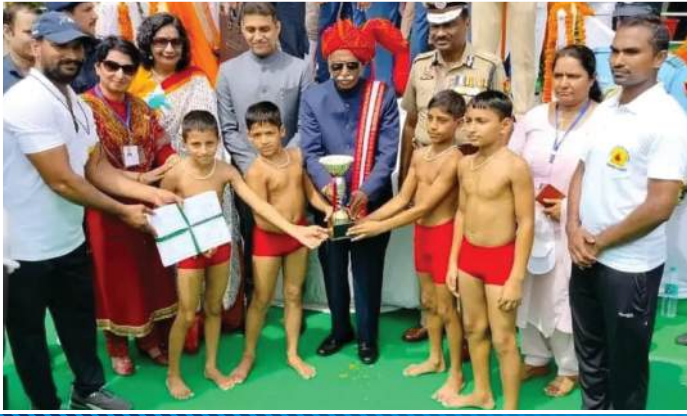
राज्यपाल महोदय के द्वारा पुरस्कृत गुरुकुल के विद्यार्थी