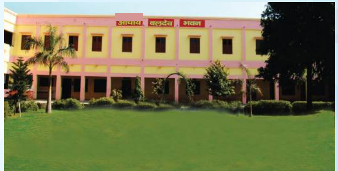
बलदेव भवन छात्रावास ( कक्षा 7वीं, 8वीं )