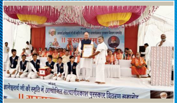
आचार्य ज्ञानेश्वरार्य जी की स्मृति में आयोजित कार्यक्रम में निदेशक महोदय जी का सम्मान