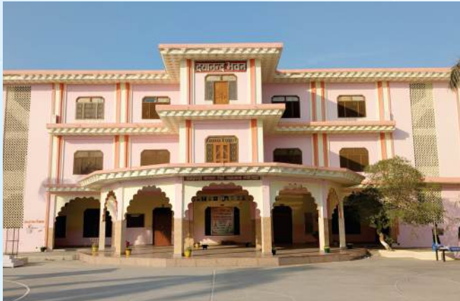
दयानन्द भवन छात्रावास ( कक्षा 11वीं, 12वीं )

विशाल छात्रावास के कमरे हवादार हैं। सभी कमरों में पर्याप्त संख्या में बिस्तर और अलमारी हैं। हर मंजिल में हाइजीनिक वॉशरूम और ऋतु अनुकूल पीने योग्य स्वच्छ जल R.O. की सुविधा है।