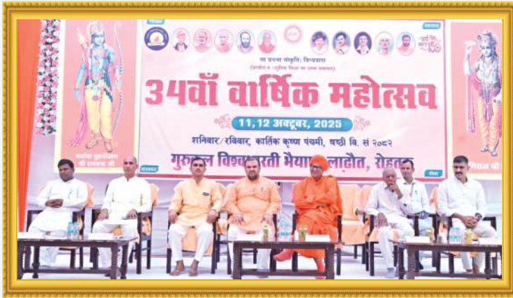
34 वाँ वार्षिक महोत्सव, गुरुकुल विश्वभारती