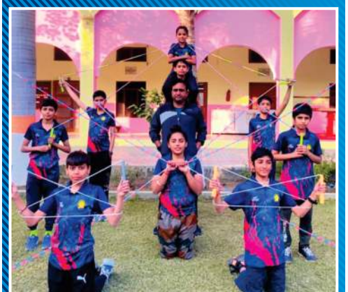
रोप स्पीकिंग टीम