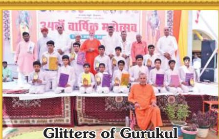
Glitters of Gurukul