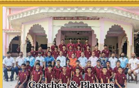
Coaches & Players