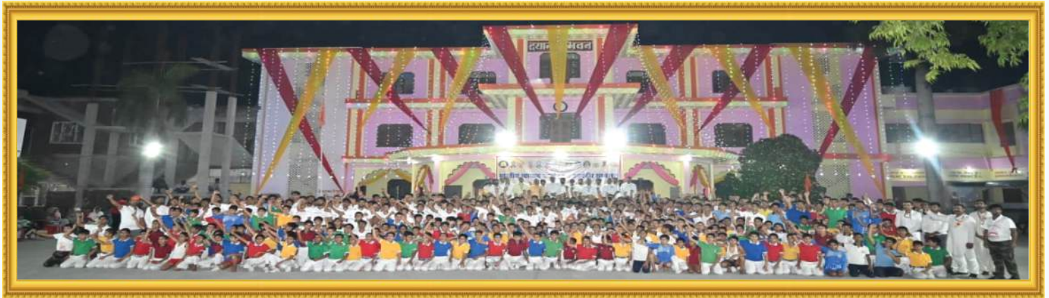
गुरुकुल विश्वभारती भैयापुर लादौत रोड़ रोहतक के विद्यार्थी, अधिकारी एवं अध्यापकगण