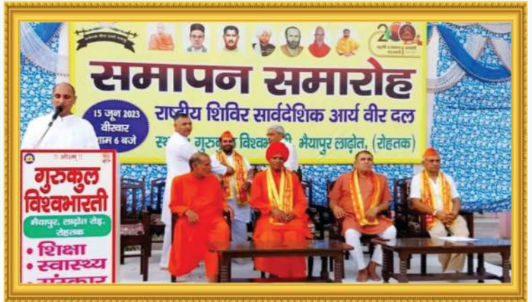
सार्वदेशिक आर्य वीर दल समापन समारोह में आचार्य जी का उद्बोधन